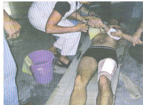
Notfallübung mit Verbrennungen

Informationen zur Betriebsanitätsausbildung erhalten Sie bei: