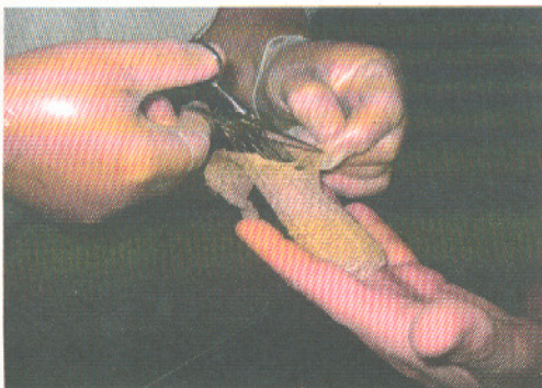
Eine Fingerverletzung wird korrekt versorgt

und Dozenten. Hier ist entscheidend, dass diese neben ihrer fachlichen und methodischen Kompetenz eine weitere Fähigkeit mitbringen müssen. Bei der Vermittlung der notfallspezifischen Themen muss ein realer Bezug zum Betriebsanitätsumfeld hergestellt werden können. Wicki + Ambühl AG erfüllt alle diese Anforderungen.