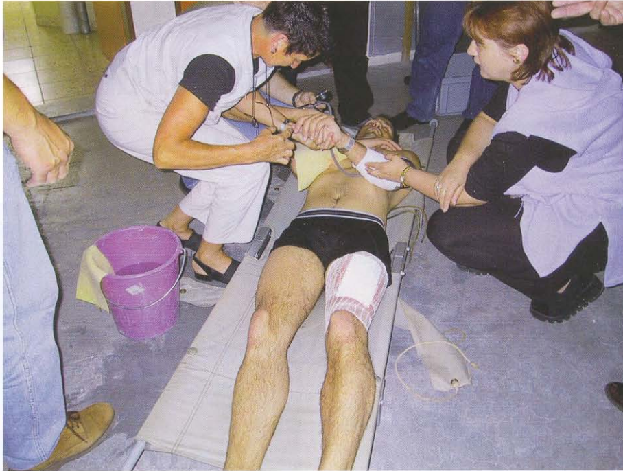
Notfallübung mit Verbrennungen

ste Szenarien eines Herz-Kreislaufstillstandes praktisch beibt.