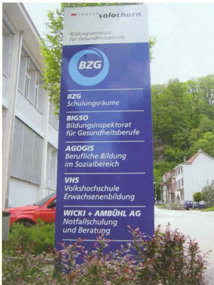
Eingangsbereich im BZG in Olten

Wicki + Ambühl AG ist in der Schweiz für die Betriebssanitätsausbildung eine bekannte Adresse. Viele hundert Betriebs-sanitärinnen und Betriebssanitäter können auf eine fachlich fundierte Ausbildung sowohl im theoretischen wie praktischen Bereich zurückgreifen. Kursstandort ist das Bildungszentrum für Gesundheitsberufe (BZG) auf dem Areal des Kantonsspital Olten.