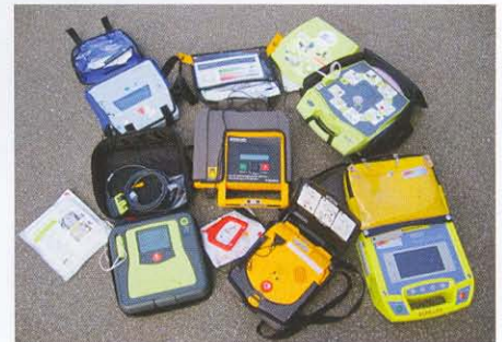
Diverse AED-Geräte stehen zur Verfügung