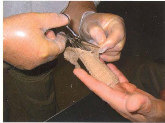
Eine Fingerverletzung wird korrekt versorgt

Die Qualität der Ausbildung hängt von verschiedenen Faktoren ab. Nicht zuletzt sind es die Kursteilnehmerinnen und Kursteilnehmer, welche sich für eine solche Aufgabe bereitstellen. Weiter sind es natürlich die Dozentinnen und Dozenten. Hier ist entscheidend, dass diese neben ihrer fachlichen und methodischen Kompetenz eine weitere Fähigkeit mitbringen müssen. Bei der Vermittlung der notfallspezifischen Themen muss ein realer Bezug zum Betriebssanitätsumfeld hergestellt werden können. Diesem Bezug wird bei Wicki + Ambühl AG grosses Gewicht beigemessen.